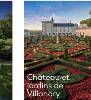
Château et jardins de Villandry