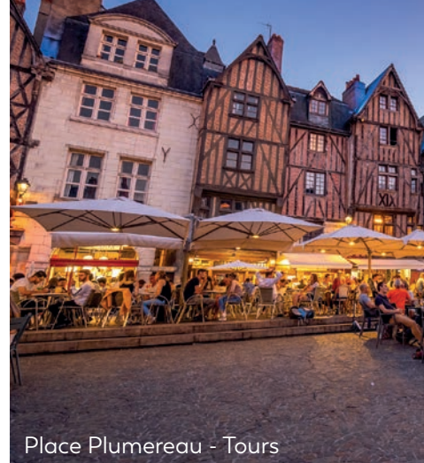
Place Plumereau - Tours