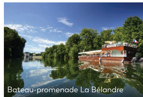
Bateau-promenade La Bélandre