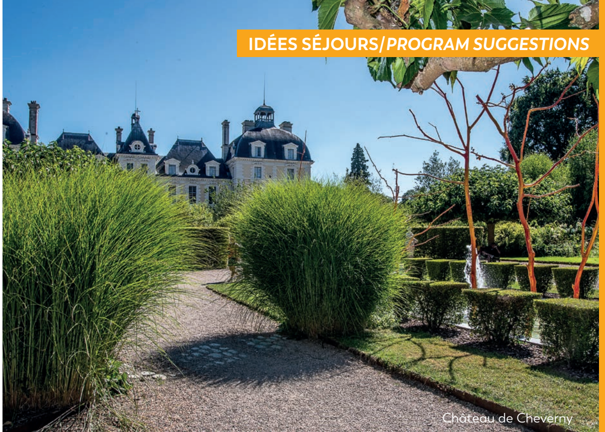
Château de Cheverny