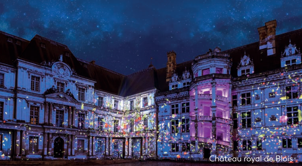
Château royal de Blois