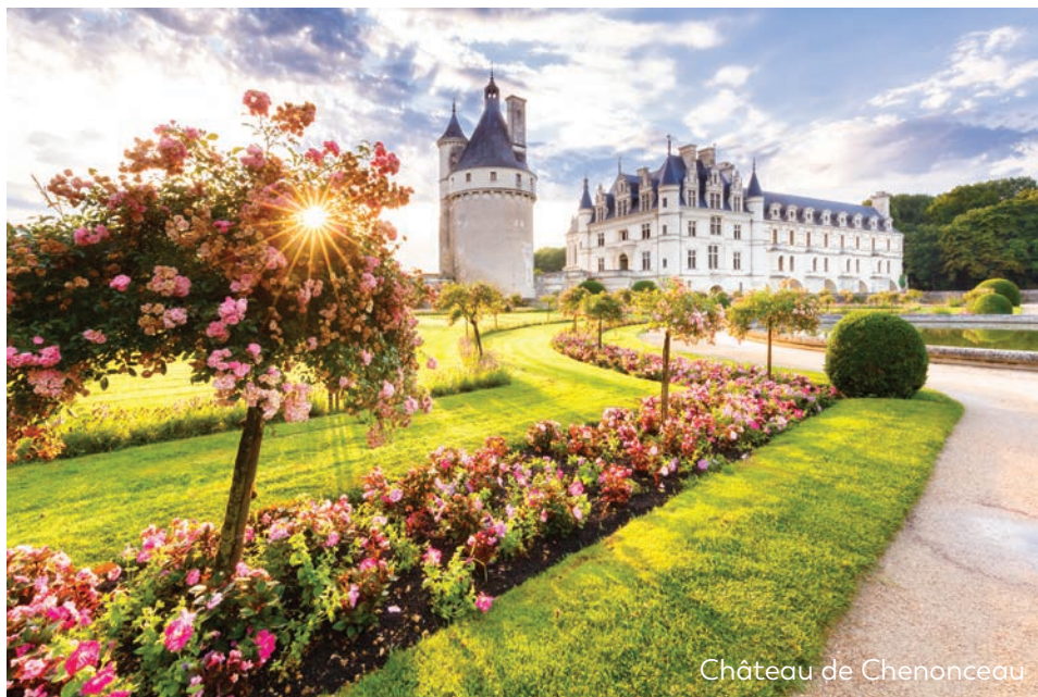
Château de Chenonceau