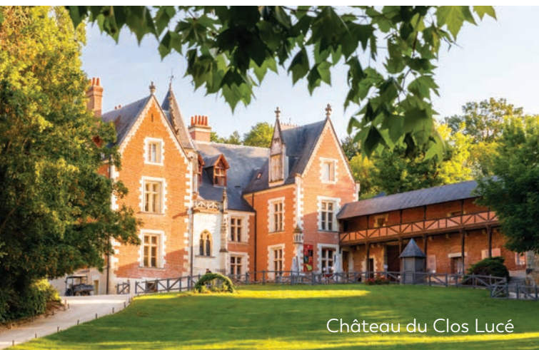
Château du Clos Lucé

Residence (soon 4*) of 20 bedrooms, 8 apartments and 4 lodges in the town centre. Then free time and diner downtown.