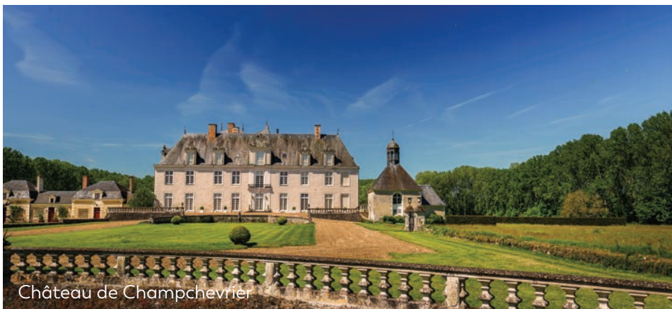
Château de Champchevrier