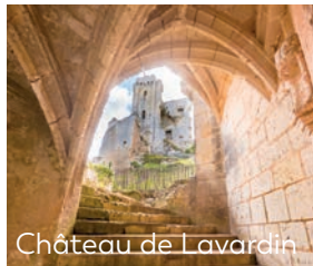
Château de Lavardin