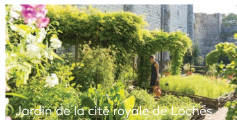
Jardin de la cité royale de Loches