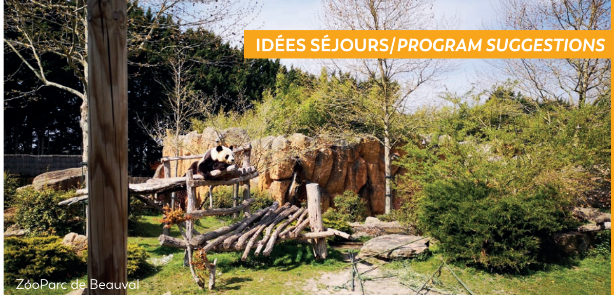
Zoo Parc de Beauval