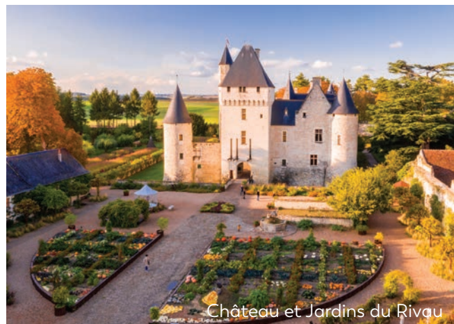
Château et Jardins du Rivau

Hôtel of 41 air-conditioned bedrooms in the city centre of Tours. Dinner downtown.