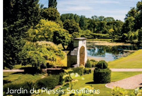
Jardin du Plessis Sasnières